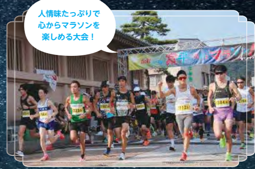
人情味たっぷり心からマラソンを楽しめる大会!