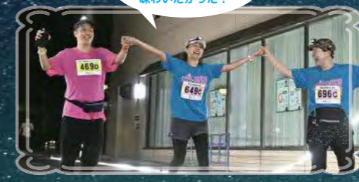
こんな幻想的なマラソン大会を味わいたかった!